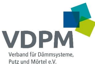
Verband für Dämmsysteme, Putz und Mörtel e.V. (VDPM)